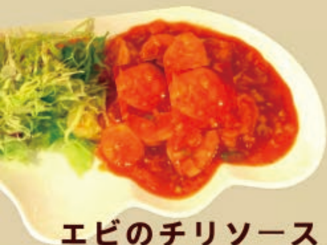
エビのチリソース 1,280円