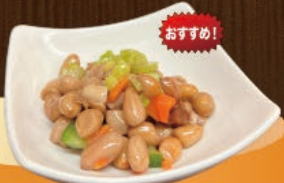
ゆでピーナッツ 350円