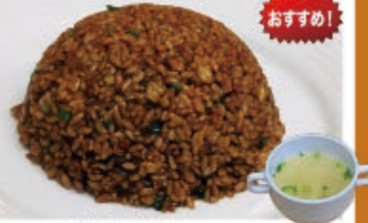
極上黒チャーハン 990円