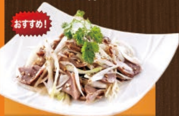
砂肝のねぎ塩加え 698円