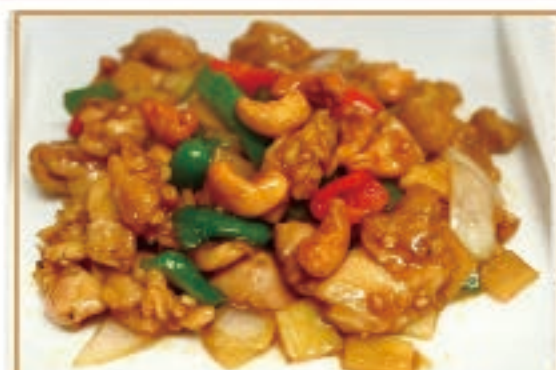
鶏肉とカシューナッツ炒め 1,100円