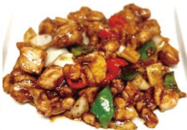
鶏肉の黒胡椒炒め 1,100円