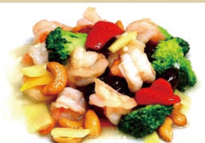
エビとカシューナッツ炒め 1,380円