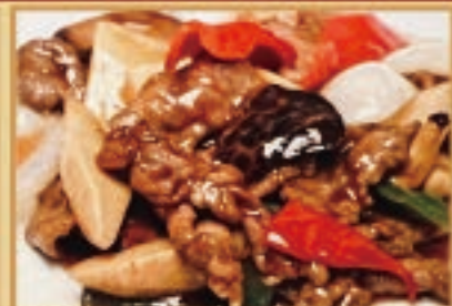
牛肉のオイスターソース 1,380円

辛さ調整可能 辛さ+1 🌶️ 55円 辛さ+2 🌶️🌶️ 110円 辛さ+3 🌶️🌶️🌶️ 165円 ニンニク増し1倍 165円 春雨増し1倍 165円