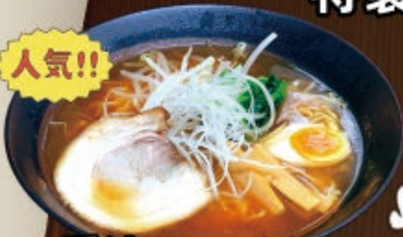
人気!! 醤油ラーメン