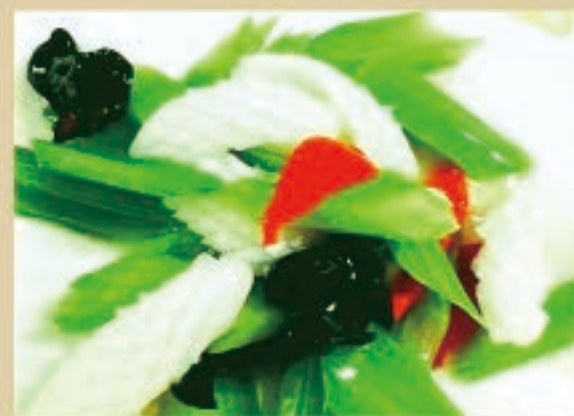
イカとセロリの炒め 1,210円