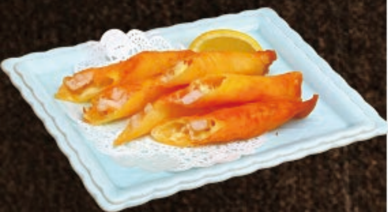
自家製 (海老入り) チーズスティック 598円