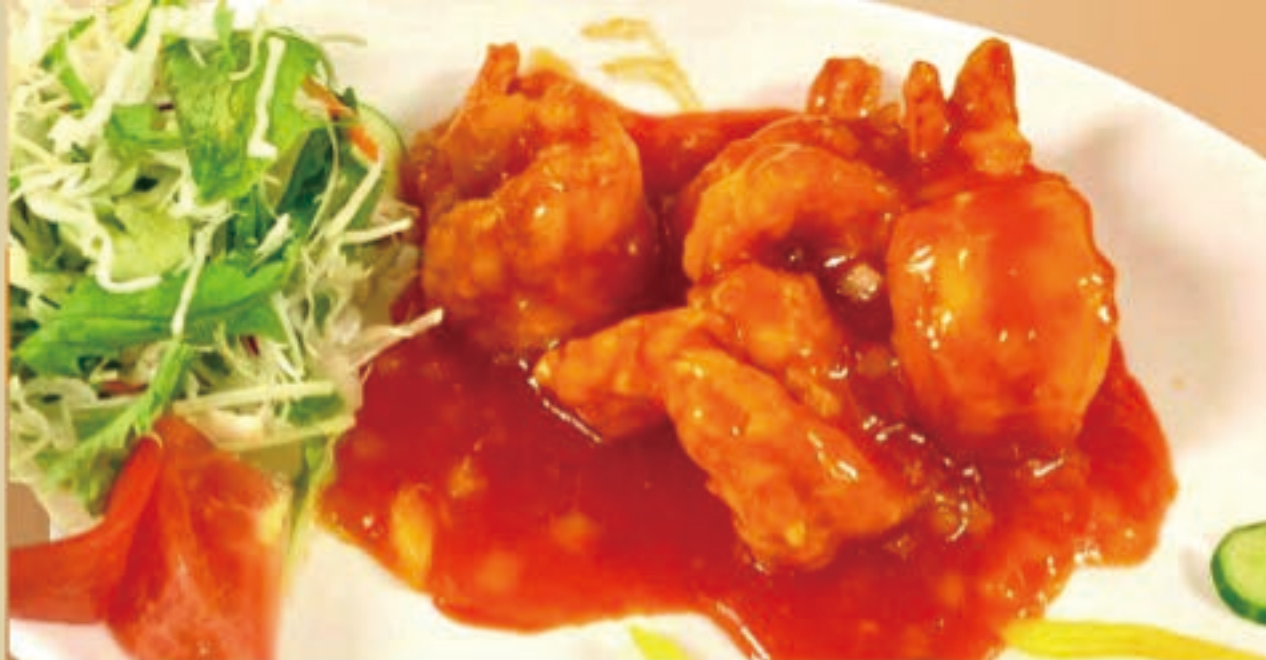
大エビのチリソース 1,580円