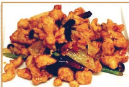
四川風鶏肉と唐辛子の辛口炒め 🌶️🌶️ 1,100円