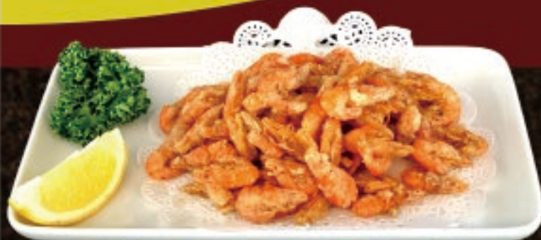
パリパリ 川エビの唐揚げ 698円