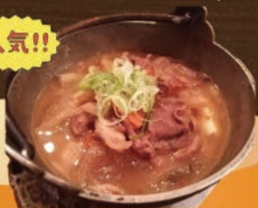
鉄鍋モツ煮込み 990円