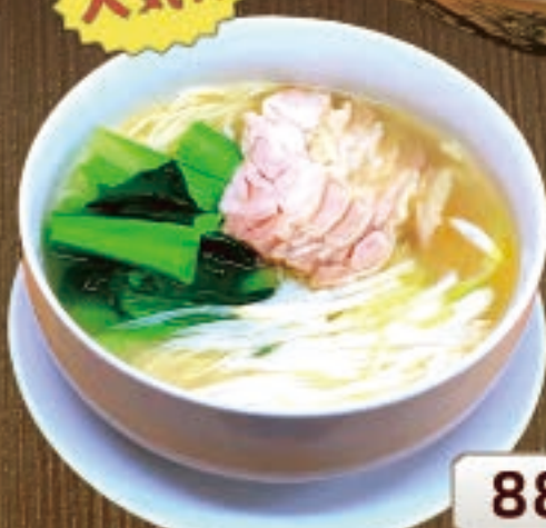
人気!! 鶏ネギ塩ラーメン