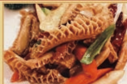
牛ハチノスの辛口炒め 1,100円