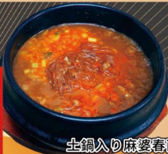
土鍋入り麻婆春雨 990円