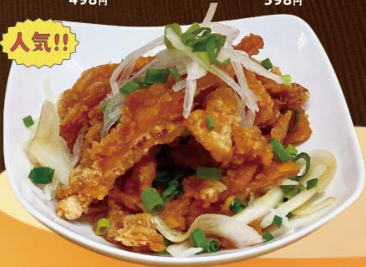
カリカリ鶏皮ポン酢 698円