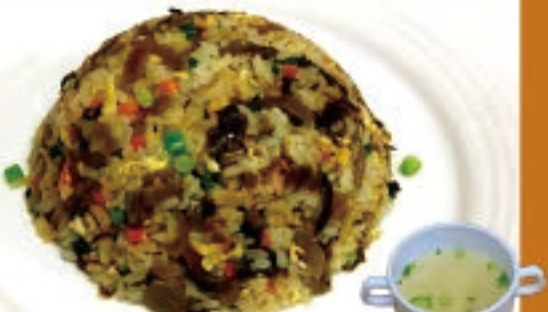
高菜チャーハン 990円