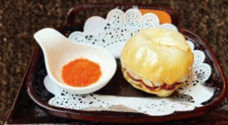
ニンニクの丸揚げ 398円