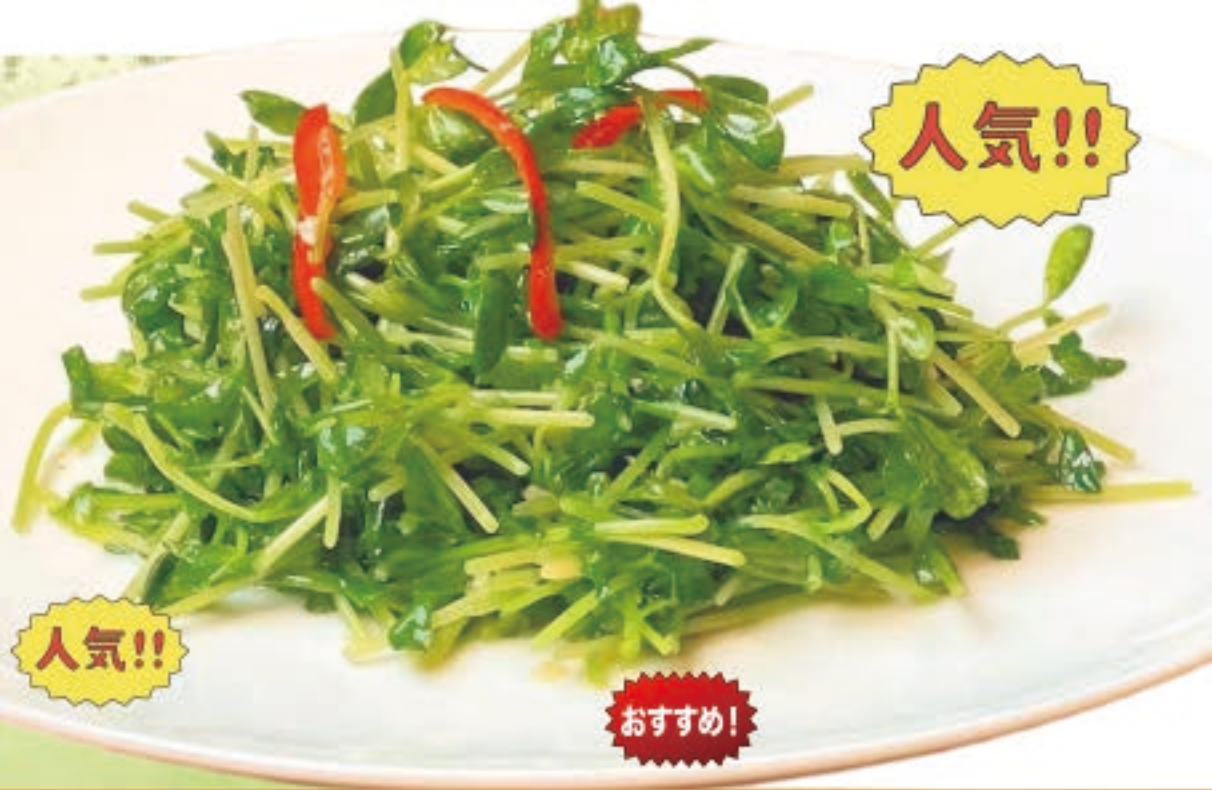
豆苗のうま塩味炒め 990円