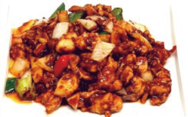
鶏肉の味噌炒め 990円

北京ダックは、下処理したアヒルを丸ごと炉で焼く中華料理。美容と健康の食材とされ、ビタミンA、ビタミンB2、コラーゲン、カリウム、カルシウム、鉄分など多く含まれています。また美肌効果があるとされ女性からの人気があります。ぜひお楽しみください。