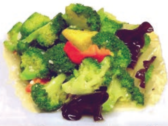
ブロッコリーのニンニク炒め 1,180円