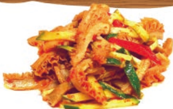
牛ハチノスのラー油和え