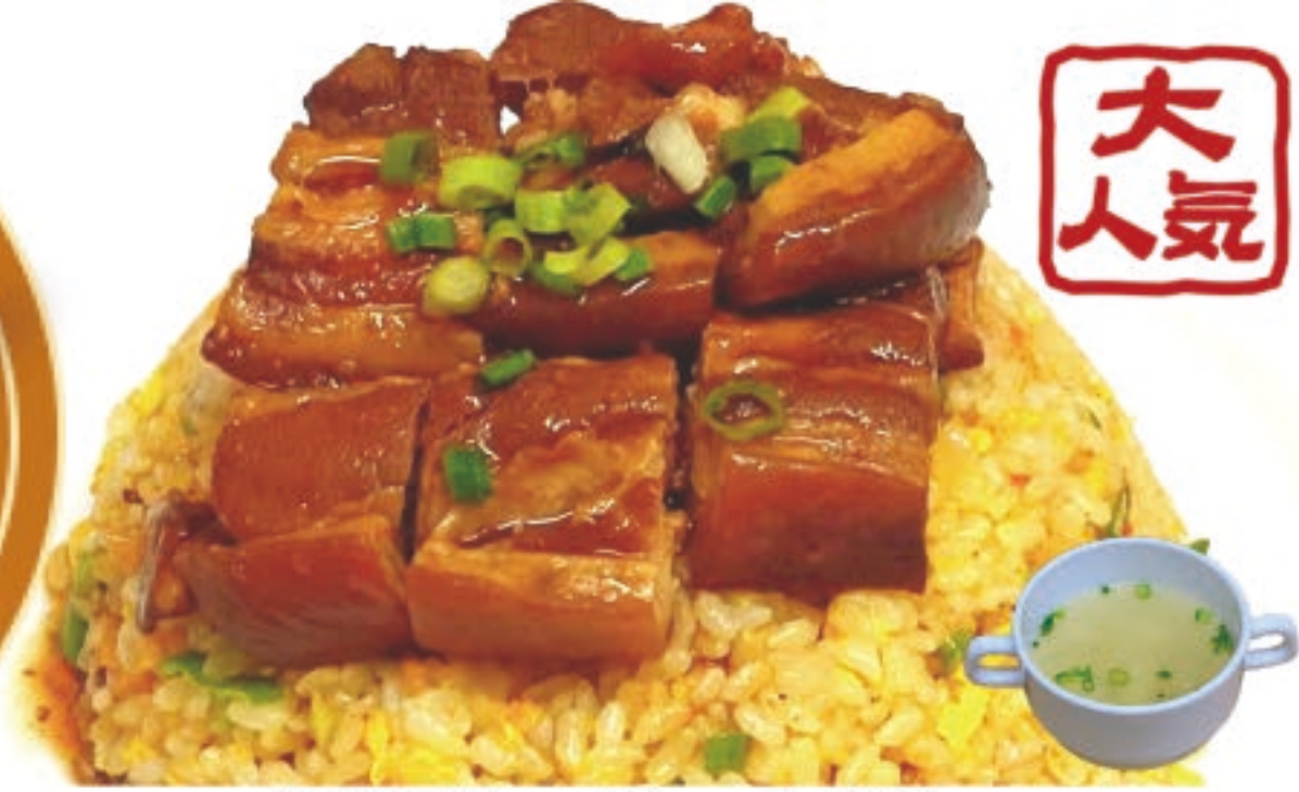
角煮チャーハン 1,180円