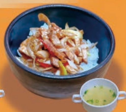
ネギチャーシュー丼 498円