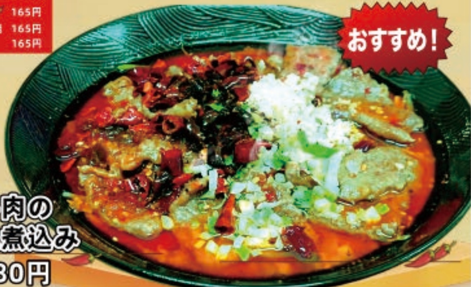
旨辛牛肉の 四川風煮込み 1,580円