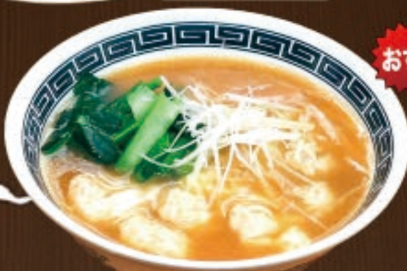
おすすめ! ワンタン麺