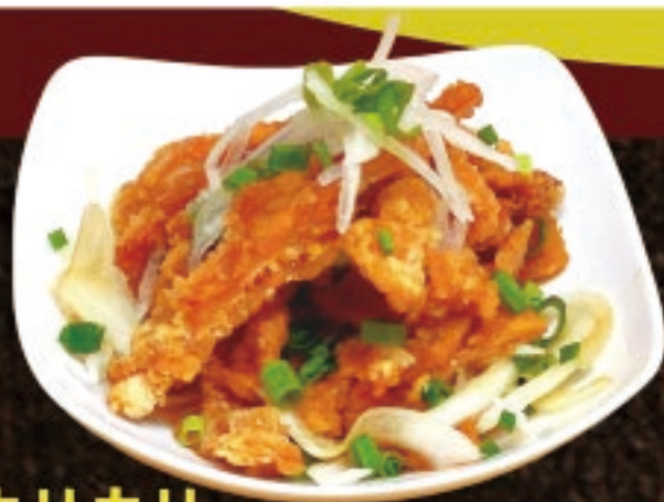
カリカリ 鶏皮ポン酢 698円