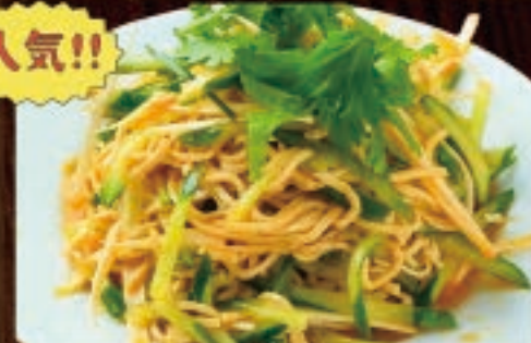
干し豆腐のヘルシーサラダ 598円