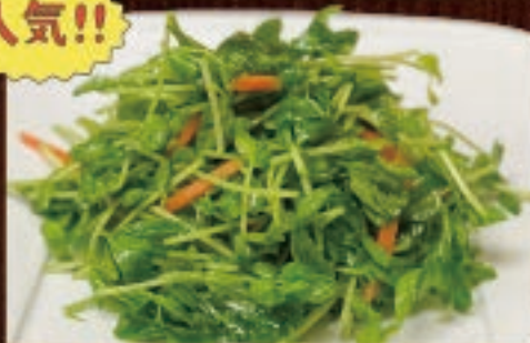
さっぱり豆苗サラダ 598円