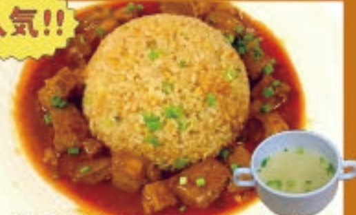
牛肉のあんかけチャーハン 1,210円