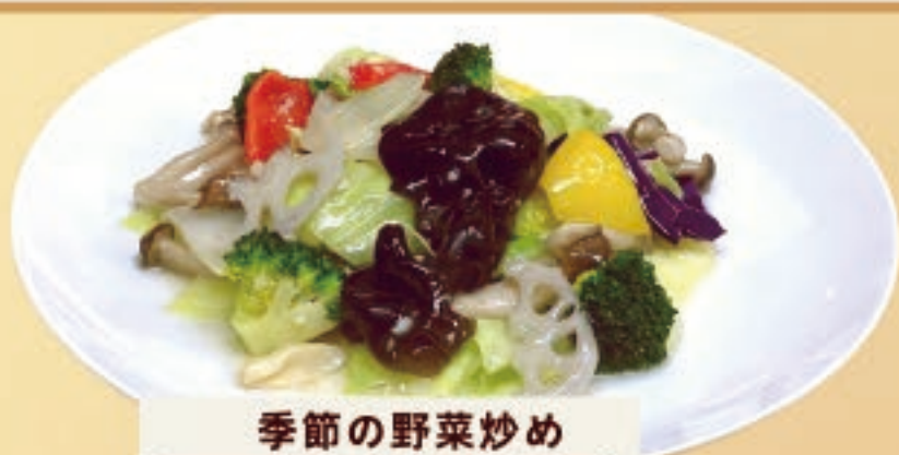
季節の野菜炒め 880円