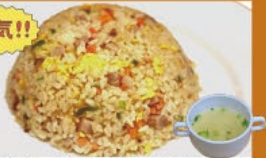
チャーシューチャーハン 1,100円