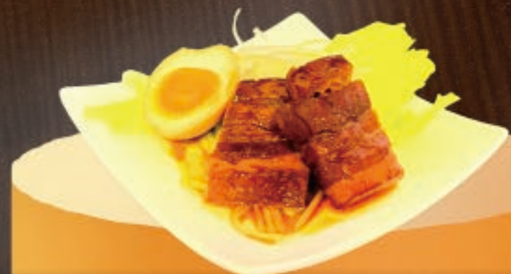
豚の角煮と味玉 498円