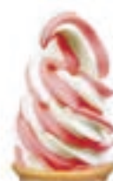
バニラ&ストロベリー