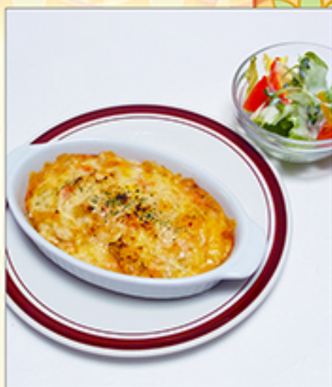
マカロニグラタン 700円