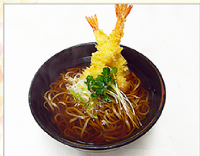
天ぷらそば・うどん 970円