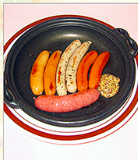
ソーセージ盛合せ 790円