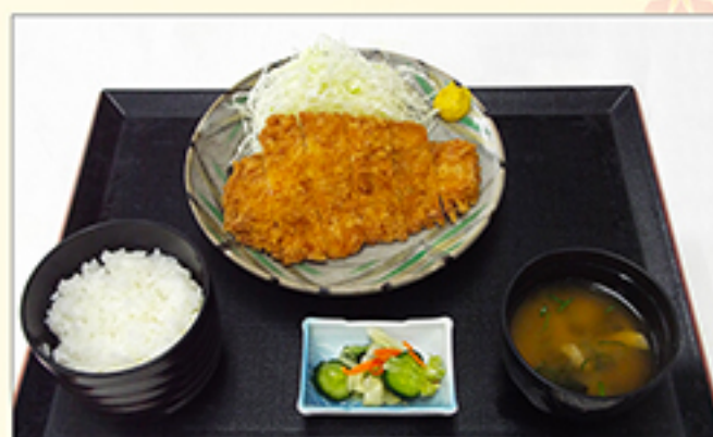
ローズカツ定食 1,090円 (単品：850円)