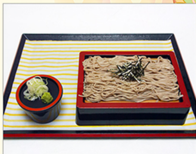
ざるそば・うどん 630円