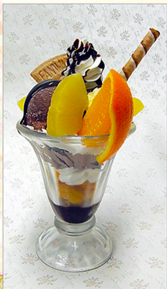
チョコレートパフェ 760円