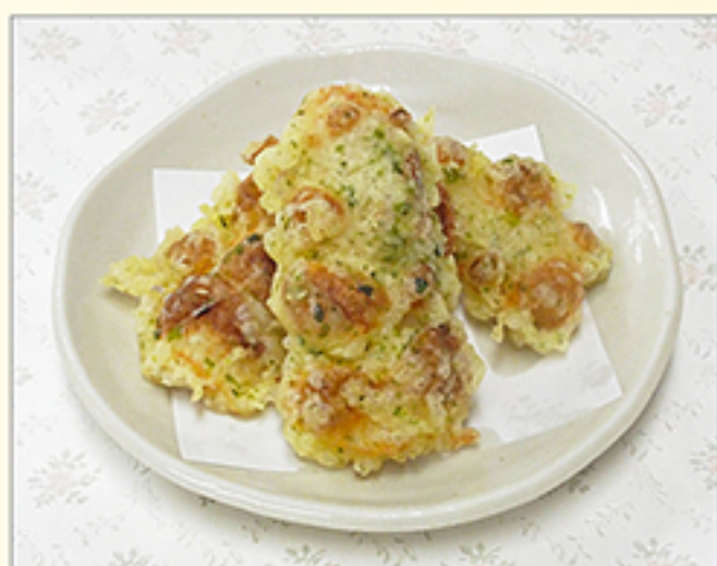
ちくわの磯辺揚げ 300円