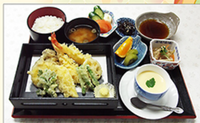
天ぷら御膳 1,580円 (内容は季節により変わります)