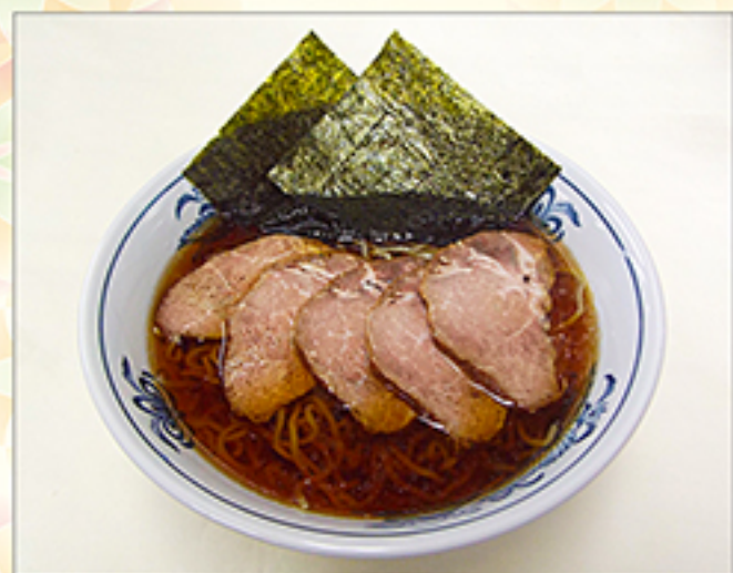
チャーシューメン 1,150円