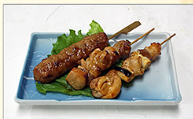
焼鳥盛合せ 730円 (タレ・塩 / つくね・正肉・ねぎ間)