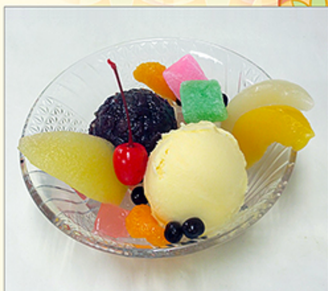
クリームあんみつ 660円