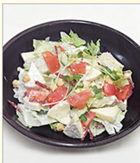
シーザーサラダ 700円