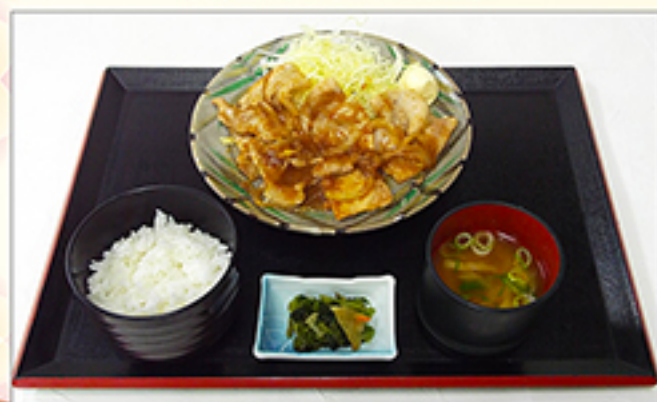
生姜焼き定食 1,030円 (単品：790円)