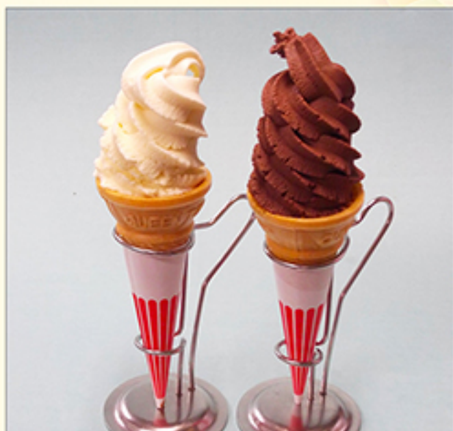
ソフトクリーム各種 460円