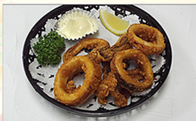
柔らかいか揚げ 600円