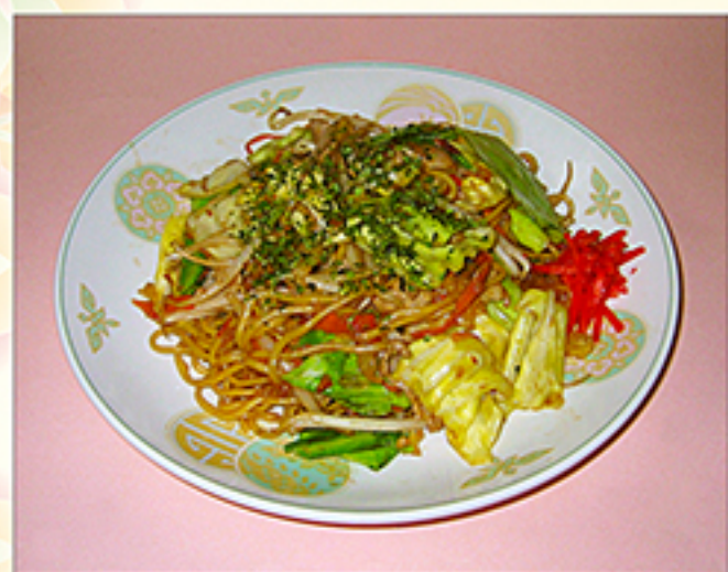
昔ながらのソース焼きそば 600円