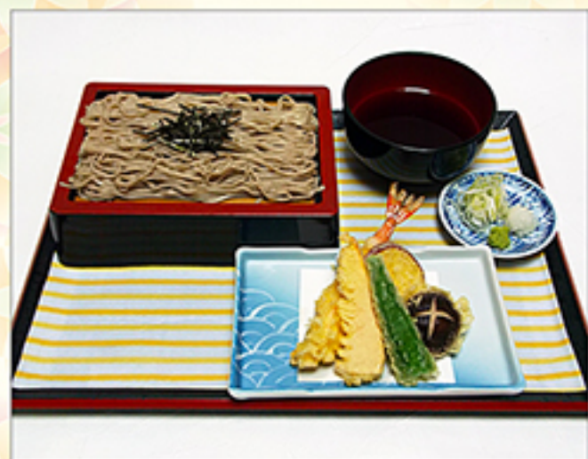
天ざるそば・うどん 1,030円 (内容は季節により変わります)