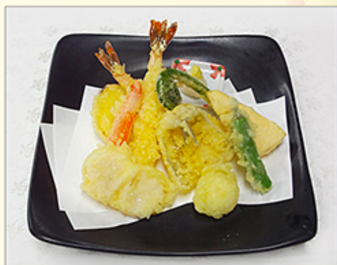
天ぷら盛合せ 1,330円 (内容は季節により変わります)