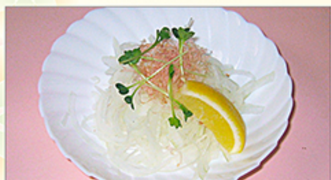
オニオンスライス 330円