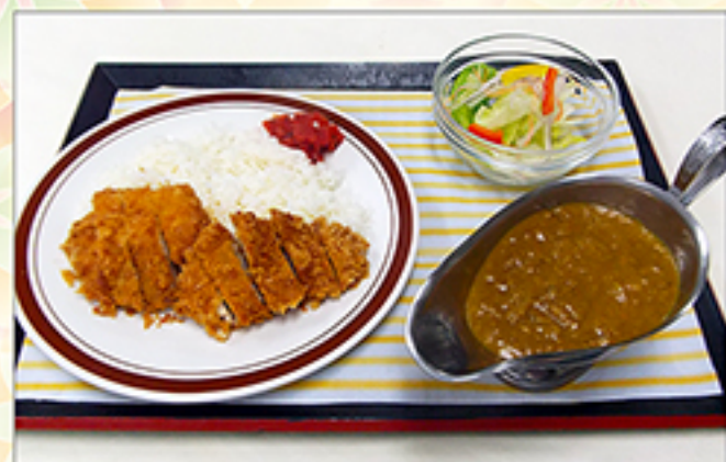
ヒレカツカレー 1,330円