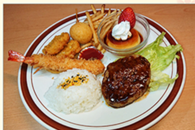
ハンバーグプレート 910円