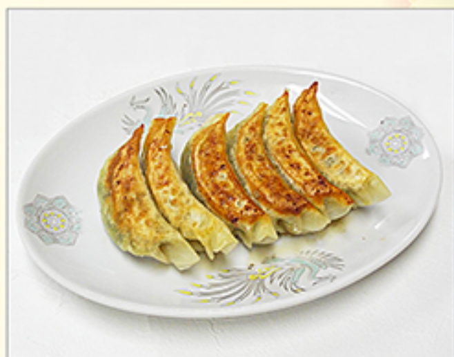
焼き餃子 485円 (自家製/6個)