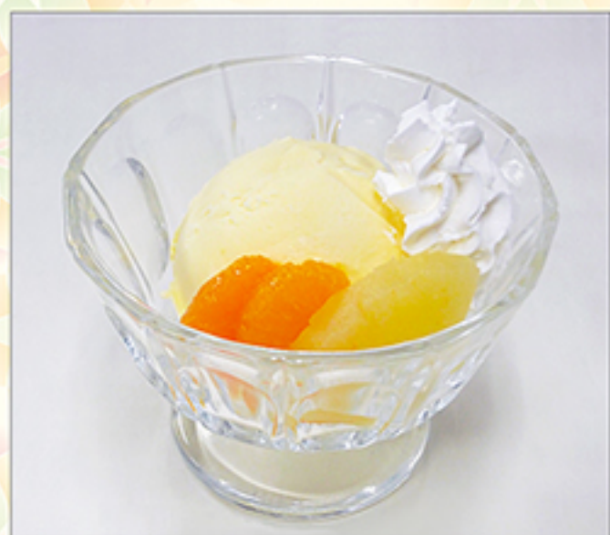
アイスクリーム 365円