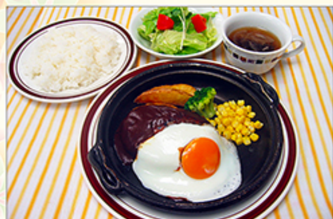
煮込みハンバーグセット 1,090円 (単品: 850円)