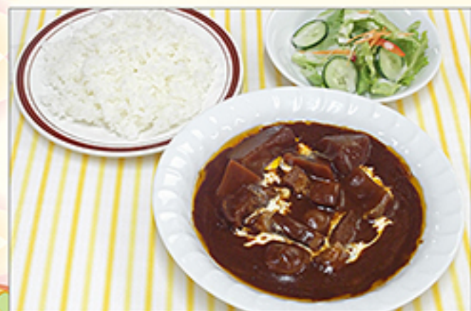
ビーフシチューセット 1,350円 (単品: 1,110円)