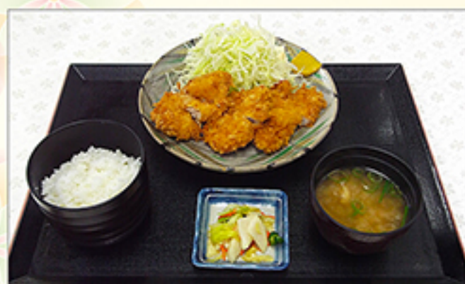
ヒレカツ定食 1,210円 (単品：910円)