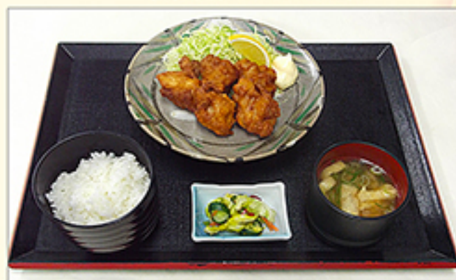
唐揚げ定食 970円 (ご飯大盛り増し：90円)