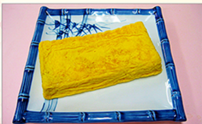
厚焼き玉子 (自家製) 770円