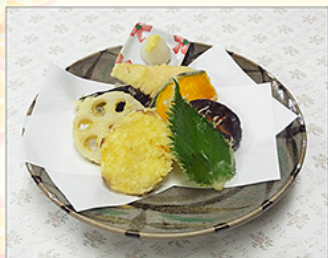
野菜天ぷら 600円 (内容は季節により変わります)