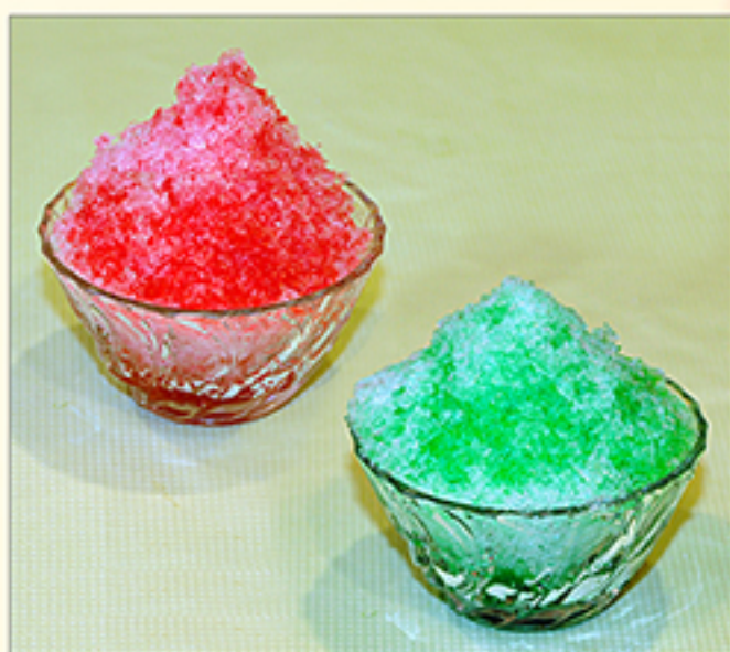
かき氷各種 (イチゴ・メロン) 365円