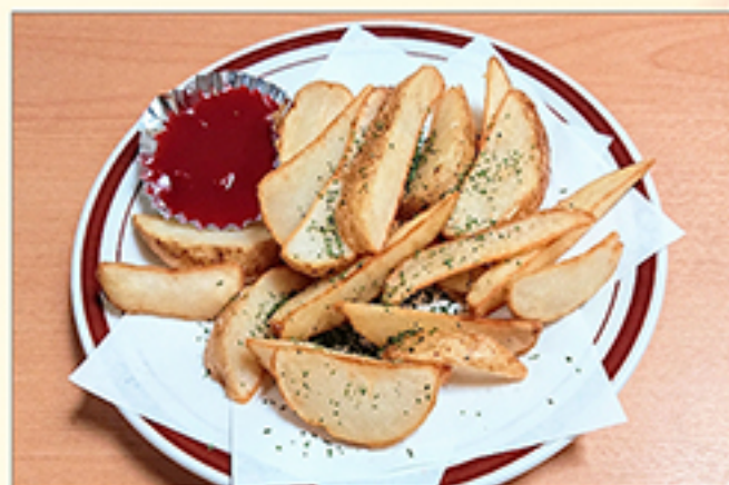
フライドポテト 380円